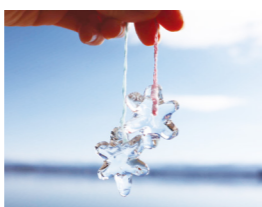
実験で作る氷のペンダント

片山津温泉に生まれ、世界で初めて人工的に雪の結晶を作り出した科学者、中谷宇吉郎博士を記念して建てられた科学館。宇吉郎の多彩な業績に触れられるほか、ダイヤモンドダストなどの不思議で美しい実験に大人も子どももわくわくできる施設です。 片山津の自然美を表情豊かに感じられる本施設は、2019年にブリツカー賞を受賞した磯崎新氏による設計。六角形の塔は雪の結晶をイメージしたものです。