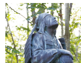
首洗池、義仲悲涙の像